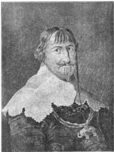
Kristian den Fjerde