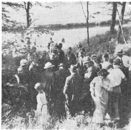
Ved Skærum Kilde.