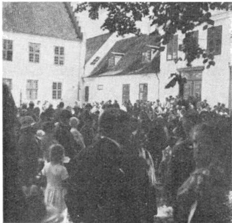
Fra Sommerstævnet paa Nr. Vosborg.