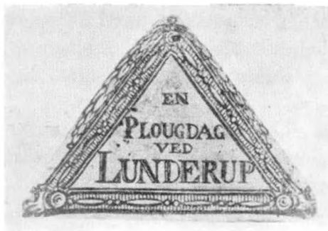
Hoveribillet. (Herning Museum).

De 5 Indtægters aarlige Brug bliver følgende: En