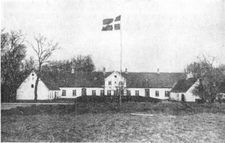
Den nuværende Hovedbygning paa Lergrav.

Aftenen, og 8. Juli begyndte den Arbejdet, lod sig foredrage Kaptajn Selmers Undersøgelse af Godset.