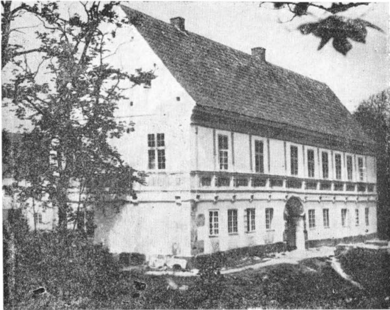
Brejninggaards Hovedbygning, nu Ungdomsskole.

I Flynder Sogn findes 8, i Tørring 2 og i Gudum Sogn 1 Bonde, de er alle hovfri.