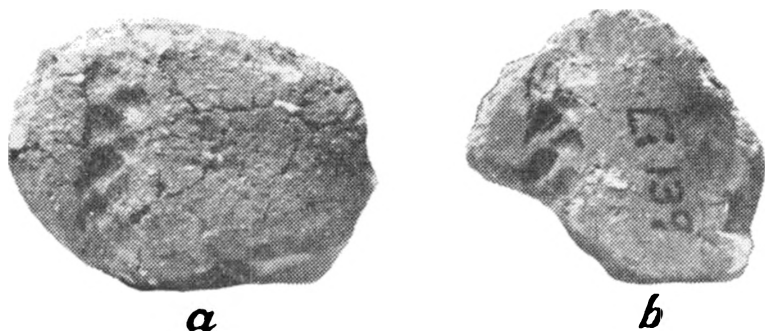
Fig. 3. Potteskår med aftryk af flettet snor. \frac{4}{3}

der var så almindelig i dyssetid og også anvendtes i tidlig jættestuetid (fig. 2, a-d); medens 5 skår er nogenlunde jævnt dækkede, er det sjette kun delvis dækket, og dekorationen har da åbenbart været ordnet i knipper (fig. 2, d). 5 andre skår er dekoreret med aftryk af snore. På 3 af disse skår er dekora-