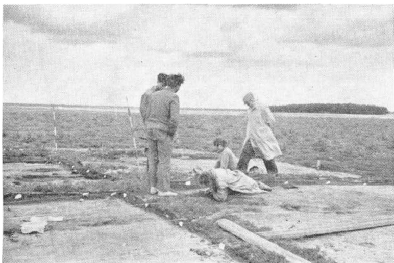
Et tyndt lag overjord er fjernet, hvorefter pillearbejdet begynder; det synes ingen ende at få. Værdigenstande kan man næppe vente at finde, men forhåbentlig nye erfaringer.

konstateret. Fire tomter er delvist afdækket, man har fundet en cirkelrund fordybning, som nok har været en brønd, den er ikke undersøgt. Hvad der særlig må interessere, er forholdet mellem boplads, byens agre og begravningsplads. Man har konstateret 7 tomter, de urørte røbes kun som svage forhøjninger i det aldeles flade terrain. Forhøjningerne hidrører fra nedstyrtede vægge, som har været af tørv eller ler. Husene har ligget i hinandens umiddelbare nærhed uden nogen øjensynlig plan, men som jernalderhuset på Hjerl hede med arnestedet i den vestlige og staldplads i den østlige ende. Et mosedrag tæt ved tomterne skal undersøges, og måske en pollenanalyse kan fortælle os noget om kornsorter og evt. skovvækst.