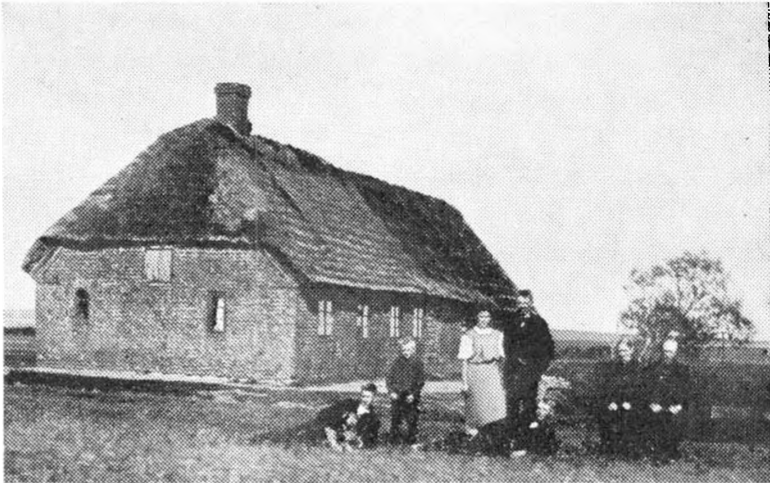
Kodalsighus i Fjaldene.