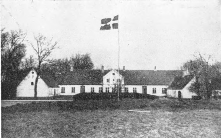
Hovedbygningen på Lergrav.

kunne påtage sig yderligere forpligtelser med hensyn til tilskud. Selv om Aulum-Hodsager sogneråd ikke var uvillig til at strække sig betydeligt, kunne det ikke sammen med Ørre nå det ønskede resultat, hvorfor det blev besluttet straks at køre til Vildbjerg og søge forhandling