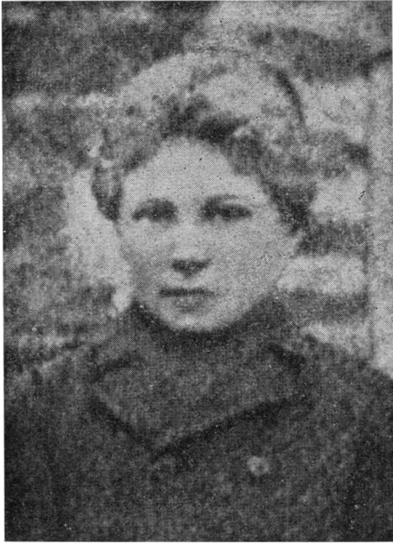
Hyrden som 12aarig.

altid i kolde Eftermiddage, hen ad Aften, at der hos een eller flere af Flokken kunde opstaa Lysten til at stikke i Løb og boltre sig paa den mest uhæmmede Maade. Om det var for at faa Varme i Kroppen eller af „sjælelige“