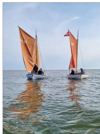
Det er et flot syn, når smækkerne sejler på Ringkøbing Fjord.

De næste syv joller var klar til sætning pinselørdag 1994, men endnu flere havde lyst til at bygge en jolle, så et tredje byggehold begyndte på fire smækker, som blev sæsat pinselørdag 1996.