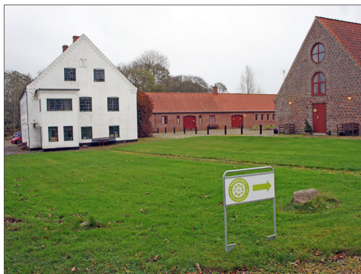
Skærum Mølle ved Vemb er igen i år ramme om Historiens Dag.

For også at sætte den helt nære lokalhistorie i perspektiv har Hardsyssel Historisk Samfund inviteret de lokalhistoriske arkiver i foreningens område til at udstille eksempler fra deres virke på Historiens Dag. På den måde får de mange lokalhistoriske arkiver mulighed for at profilere sig i en større geografisk sammenhæng og inspirere andre, der brænder for lokalhistorie i deres respektive områder.