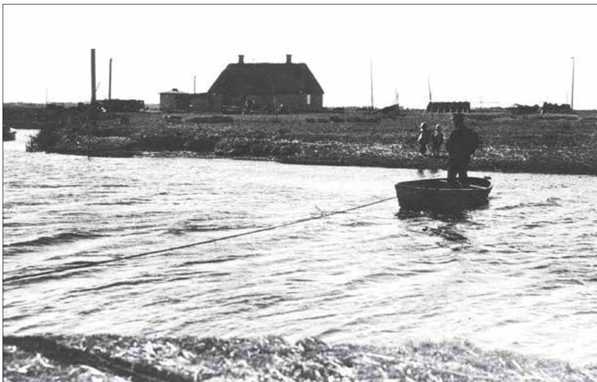
I dag kan man fra Pumpestation Nord tage en trækfærge over Skjern Å. Men for mange år siden var der en trækfærge over den daværende Blindaa. Her ses postbudet, der er på vej med den lille trækfærge.

Af Thora Juul Larsen. - Det Kgl. Danske Post- og Telegrafvæsen satte engang en stor ære i, at posten nåede frem, uanset vejr og vind. Især på småøerne var postbåden en helt nødvendig livline, og mangen en gang har et postbud trodset vejr og vind. Ja, vel også med livet som indsats. Det kan næsten være umuligt at forstå for os i dag, der ikke længere betjenes af et dansk postvæsen, og som må sande, at der er planer om en særlig postordning til det såkaldte Udkants Danmark i form af differentierede takster og en enkelt omdelingsdag om ugen.