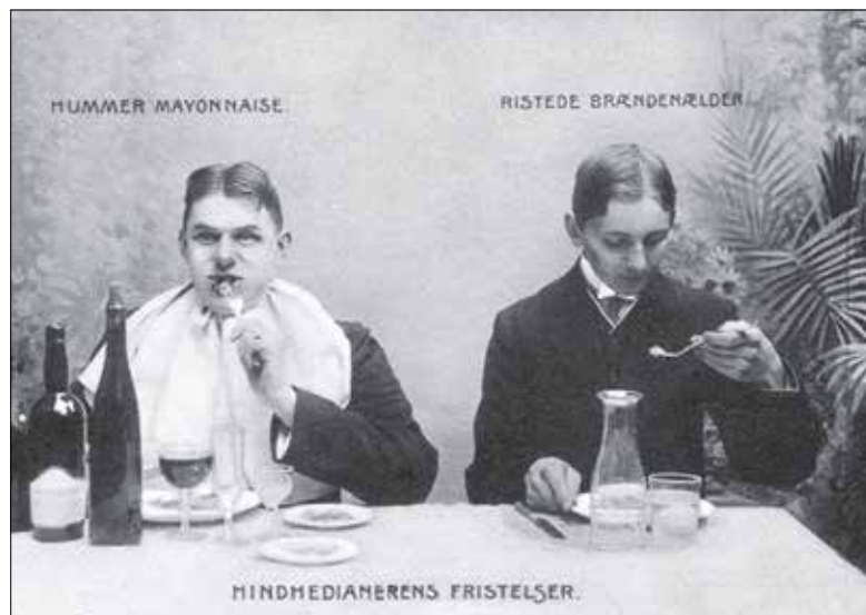
Hindhedianernes fristelser ca. 1910.

Læs mere om Hindhede på: helsenyt.com , skanderborgleksikon.dk