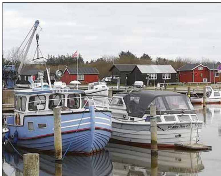
Den gamle postbåd, »Spar 2«, mellem Esbjerg og Fanø er en sej dame, der klarer at ligge i vandet hele året.