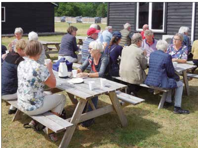
Søby Brunkulslejer har hvert år besøg af mange turister. Dette billede er fra 2018, hvor Historisk Samfund af 1906 holdt sit sommermøde her.

Der var således ikke meget familieliv. Kun hver anden søndag kunne der blive lidt tid sammen med