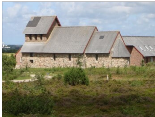
Hellig Kors Kloster er ramme om Historisk Samfunds sommermøde den 24. august.

Hardsyssel Historisk Samfund udsender med jævne mellemrum et elektronisk nyhedsbrev til vores medlemmer med stort og småt om arrangementer, hvad bestyrelsen har gang i, og hvad du som medlem kan forvente og glæde dig til.