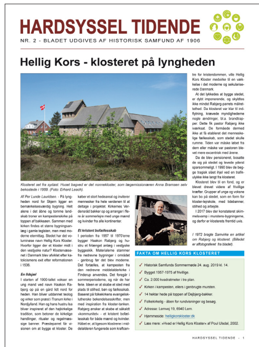
Forsiden af det seneste nummer af Hardsyssel Tidende.

I 2018 udgav Hardsyssel Historisk Samfund af 1906 et prøvenummer af Hardsyssel Tidende. Det slog så godt an, at det andet nummer af avisen udkom i starten af foråret 2019 i 2.000 eksemplarer. Avisen, der er på otte sider, kan bl.a. hentes på biblioteker og museer i det midt- og vestjyske område og andre offentlige steder, hvor der kommer mange mennesker.