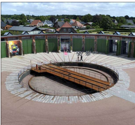
Foreningens årsmøde er lørdag den 5. marts 2022 i Remisen i Brande, der i dag er kultursted.

I skrivende stund er vi stadig ikke sluppet fri af coronaen, men den forhindrer os ikke at være i gang med planlægningen af foreningens tre arrangementer i 2022 – årsmødet/generalforsamlingen, sommermødet og Historiens Dag: