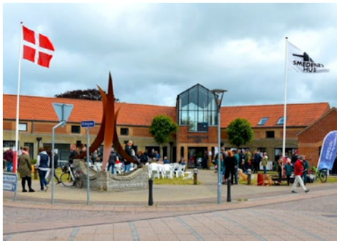
Smedenenes Hus, centralt beliggende i Lem.

Hardsyssel Historisk Samfund har tre årlige arrangementer for medlemmerne - årsmødet med generalforsamling, sommermødet og Historiens Dag. Efter årsmødet, der blev holdt i Kulturremisen i Brande den 5. marts, er tid og sted for sommermødet og Historiens Dag nu også på plads: