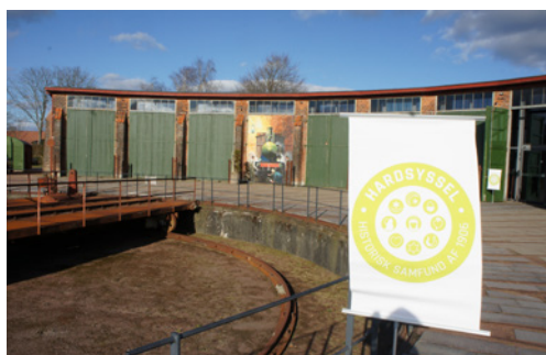
Hardsyssel Historisk Samfund sørger for at komme rundt i hele foreningens geografiske område med sine arrangementer. Ved årsmødet 2022 førte sporet til Kulturremisen i Brande.