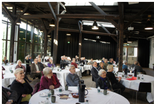
Kulturremisen med højt til loftet var en spændende ramme om Hardsyssel Historisk Samfunds årsmøde. Der var ca. 50 deltagere i mødet.