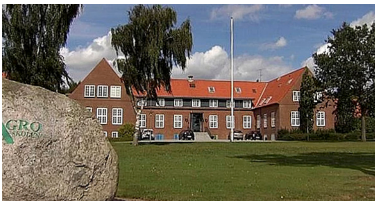
Agroskolen i Hammerum er ramme om foreningens årsmøde.