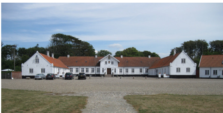
Lønborggård ved Tarm er ramme om foreningens sommermøde.