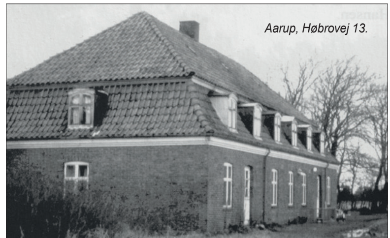
Aarup, Høbrovej 13.

I besættelsestiden oprettede Socialministeriet en række arbejdslejre for byernes arbejdsløse mænd. Det skete bl.a. for at afholde dem fra at arbejde for besættelsesmagten. I Ringkøbing Amt oprettedes bl.a. lejre i Klosterheden - Ulfborg Kjærgård, Hoverdal og i 1942 Øster Aarbjerg i Torsted. Lejren kunne rumme mere end 100 mand, der blev beskæftiget med plantageanlæg, skovning, vejarbejde og grusharvning. Nu er lejren nedlagt, og alle bygninger fjernet.