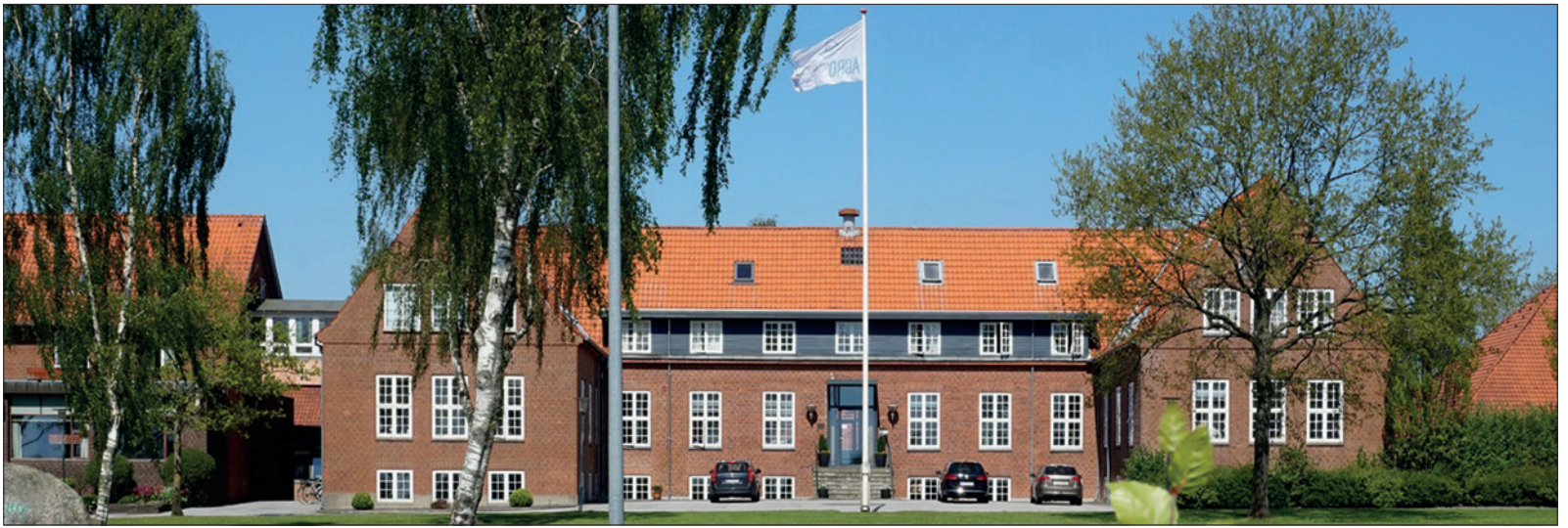
Agroskolens smukke bygning i Hammerum skal sælges, men de 30 ha landbrugsjord bibeholdes, for den er landbrugselevernes værksted.