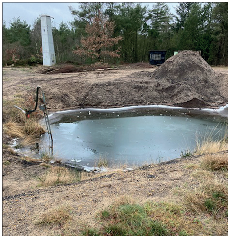
En "brunkulsmine", hvor vandsneflen ikke har været i brug længe.

Brunkul er rester af ca. 15 millioner år gamle sump- og vandplanter, fra en tid da floder og søer dækkede det meste af Danmark. De fleste brunkul findes i Midtjylland, og de har relativ stor brændværdi - større end f.eks. træ, men mindre end kul og koks. I Abildå-området har der under 2. Verdenskrig og i perioder derefter dagligt arbejdet 300-400 mand med brydningen.