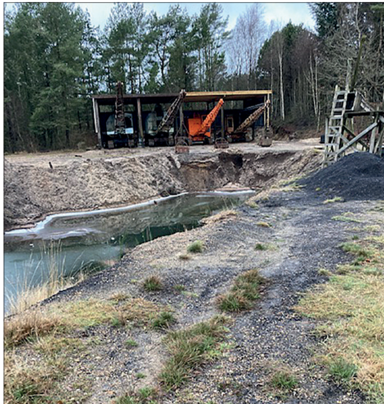
Gravemaskiner, som arbejdede i Abildå Brunkulsleje.