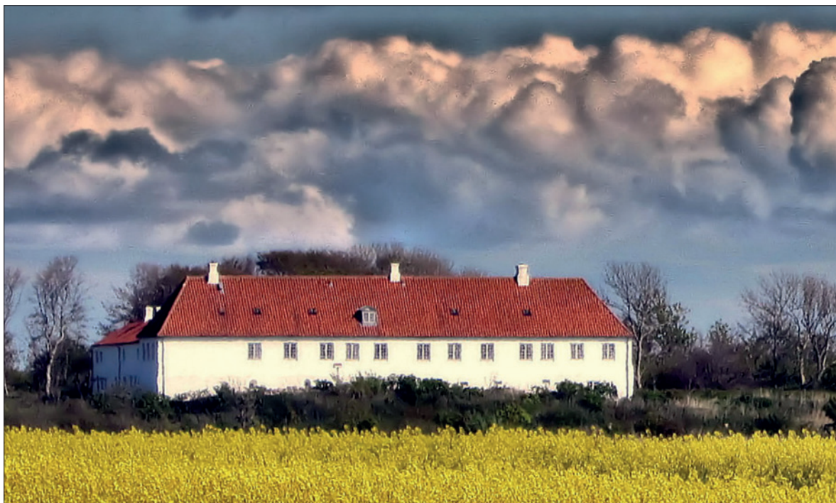
Herregården Rysensteen ligger på sin borgbanke ude i engene ved Nissum Fjord, nær ved den jyske vestkyst.

Af Jens Erik Villadsen. - Også for fire hundrede år siden vidste folk på vestkysten, hvad de ville - og i allerhøjeste grad, hvad de ikke ville.