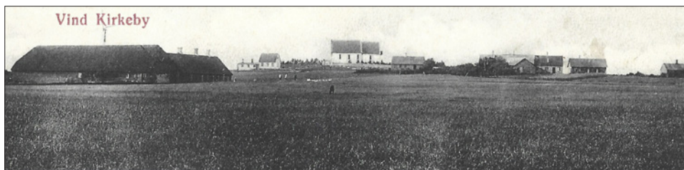
Vind Kirkeby og Stråsø Skole, anvendt som postkortmotiv omkring 1910.