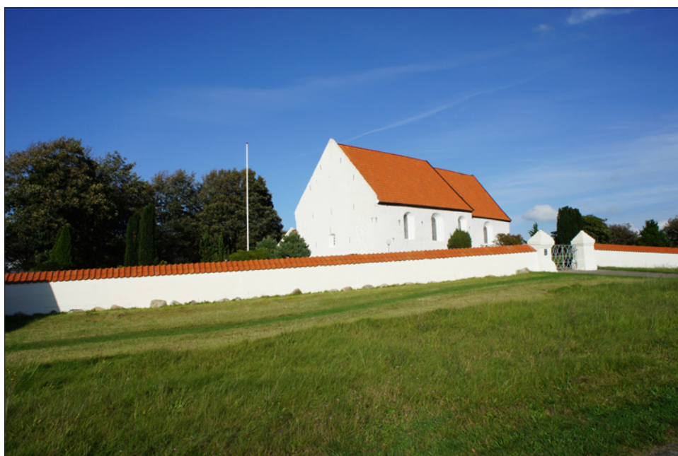
Vind Kirke i september 2023.