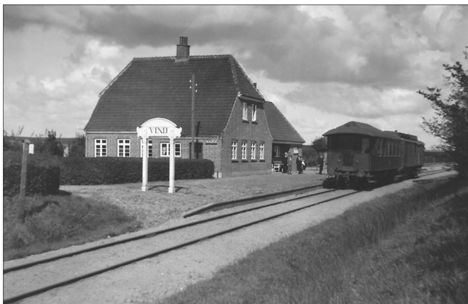
Vind Station på jernbanelinjen Ørnhøj-Holstebro, der var i drift fra 1925 til 1961.