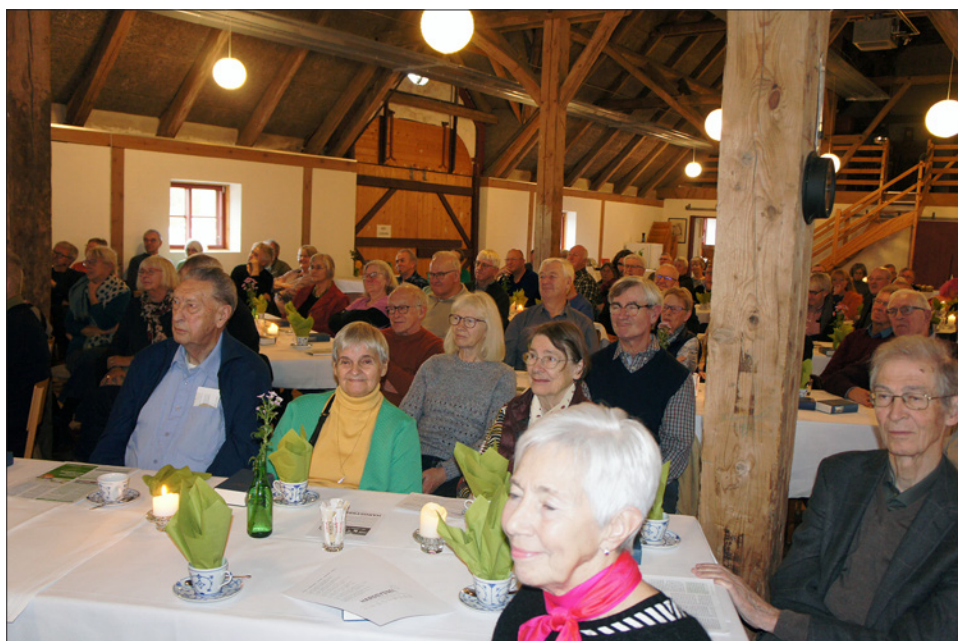
Der var fuldt hus i Skærum Møllens lade til Historiens Dag.