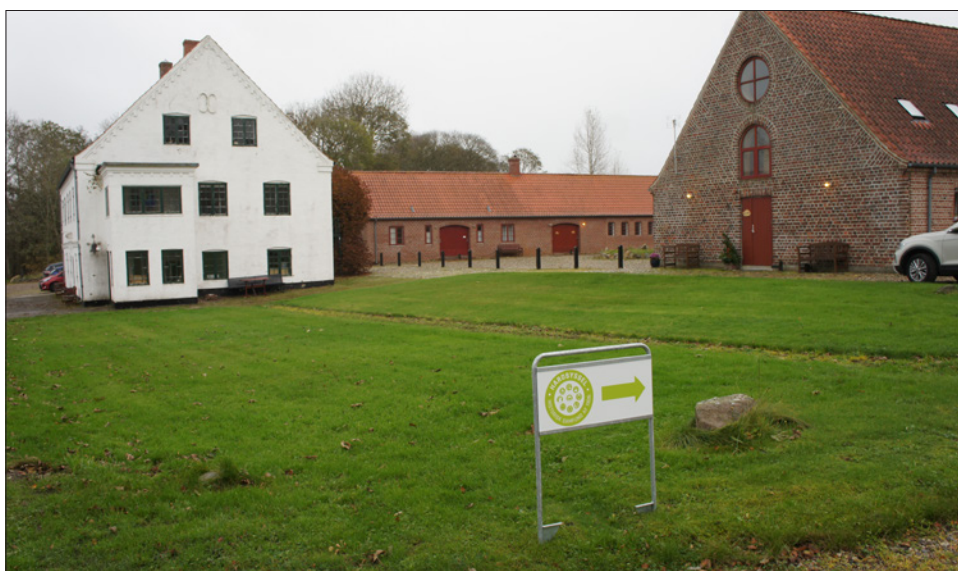
Skærum Mølle var den perfekte ramme om Historiens Dag, hvor emnet især var Villemoes-slægten, der med udgangspunkt i bl.a. Skærum Mølle satte sig mange spor – lokalt, nationalt og også internationalt.