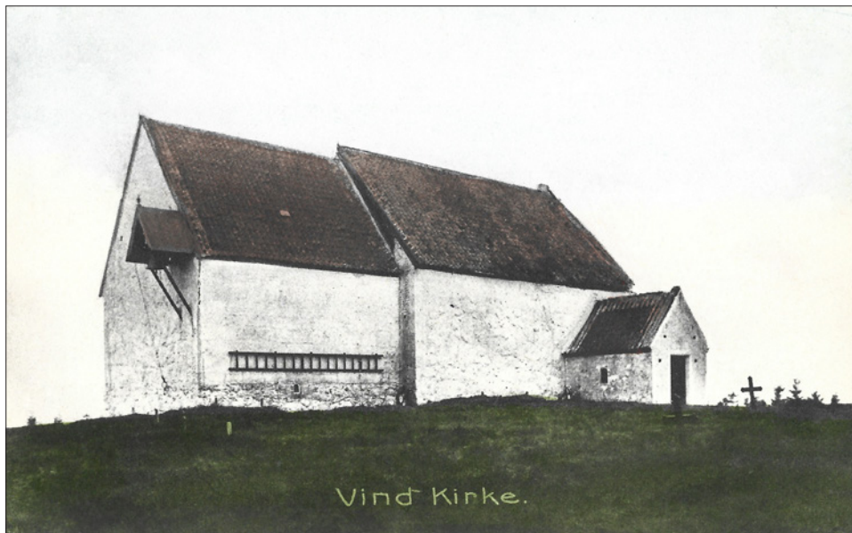
Et af de ældste, kendte fotografier af Vind Kirke, der i historien er nævnt første gang i året 1326.