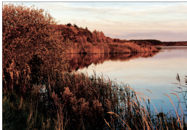
Fra Kragelundvej mod nordøst.

mand fra København blevet erstattet af en ny og ukendt, som bekendtgjorde, at sagen skulle stilles i bero, da man ikke havde gennemført en VVM (Vurdering af Virkning på Miljøet) undersøgelse, som for nylig var vedtaget for disse projekter. Egentlig var sagen så langt fremskreden, at man med en vis behændighed kunne se bort fra VVM og spare en kostbar undersøgelse, som med stor sikkerhed ikke ville give nye oplysninger. Mod en passende betaling fik Århus Universitet opgaven og afleverede i år 2000 to digre værker om, at projektet ville gavne naturen, og den skadelige okkerudledning ved kanalen og senere til Karup Å mindskes betydeligt. Efter tre år kunne fredningssagen genoptages og det nødvendige forberedende arbejde gennemføres, såsom fjernelse af bevoksning, som blev sat under vand. Ligeledes foretog Herning Museum en del arkæologiske undersøgelser, som yderligere gav viden om bosættelser i Jægerstenalderen.