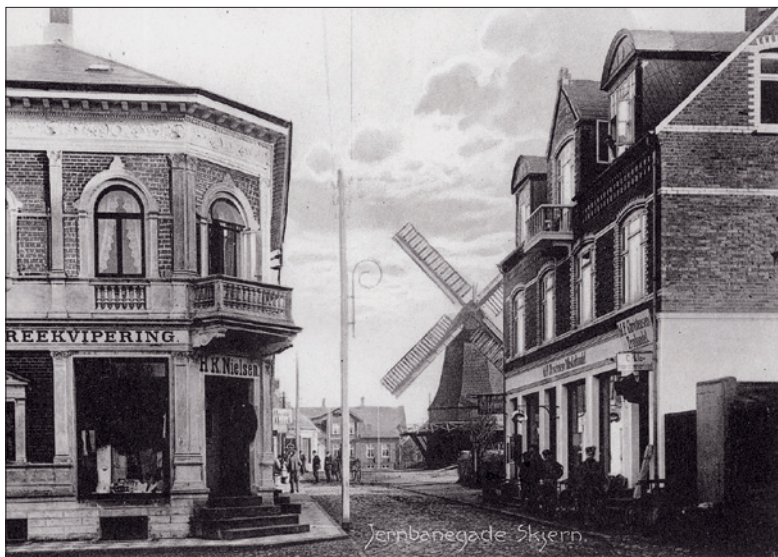
Jernbanegade i Skjern.