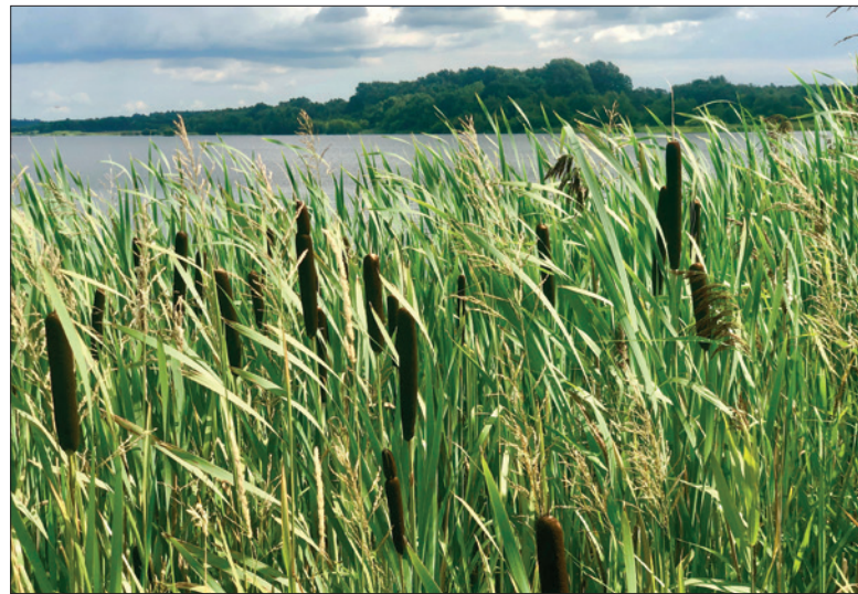
Fra Kragelundvej mod øst.

I 1996 var alt i det store og hele klart, så Fredningsnævnet kunne afsige den endelige kendelse. Men på et offentligt møde med Fredningsnævnet var den hidtidige embeds-