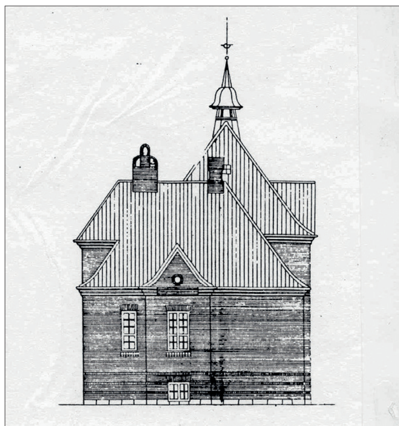
Facadetegning af gavl på amtssygehuset i Ringkøbing.