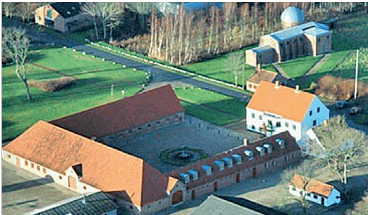
Folkeuniversitetscenter Skærum Mølle med den firlængede møllegård og på den anden side af vejen "Huset for sten og stjerner" og det gamle teglværk.