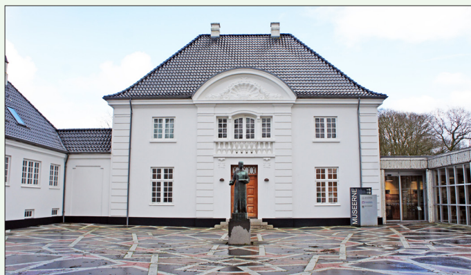
Holstebro Museum er ramme om årsmødet lørdag den 1. marts i Hardsyssel Historisk Samfund.

VIGTIGT: Af hensyn til kaffen er tilmelding til årsmødet nødvendig.