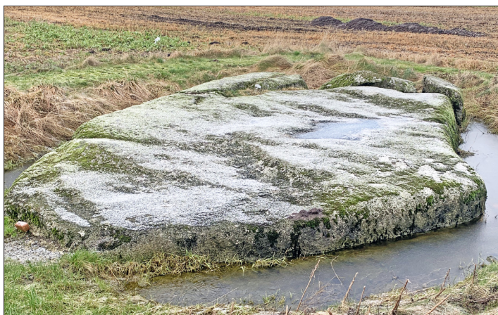
Danmarks næststørste sten – Mørup-stenen – ligger få stenkast fra Herning.