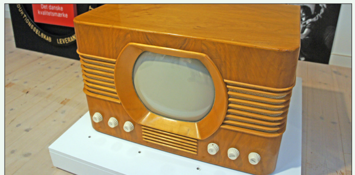
Fra Struer Museums B&O-udstilling ses her virksomhedens første fjernsyn fra 1950. Dengang var størrelsen på tv-skærmen, hvad der stort set svarer til skærmen på en I-pad i dag.

Pris pr. person , inkl. entré, er 150 kr. for medlemmer og 200 kr. for ikke-medlemmer.