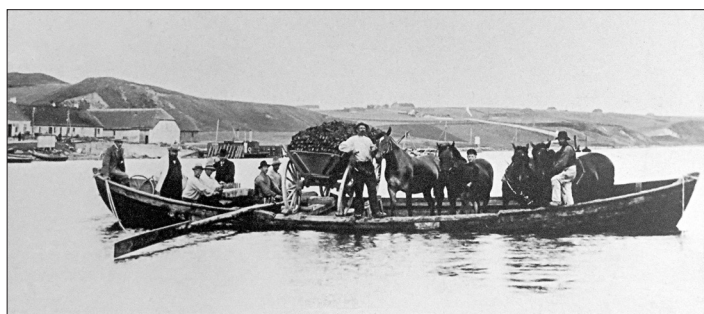
Færgenoverfart ved Virksund. På samme måde foregik det ved Oddesund.