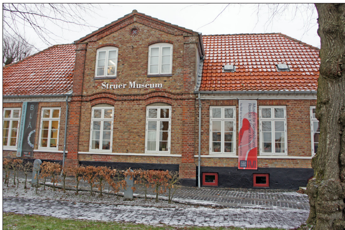
Struer Museum er ramme om årsmødet lørdag den 14. marts i Hardsyssel Historisk Samfund.