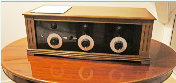
Fra Struers Museums B&O-udstilling ses her virksomhedens første lysnetmodtager fra 1925.